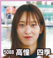
5088 高憧 四季