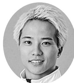
5196 鰐部太空海 A1 愛知 6.60